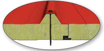
Birleşim Detayı Joint Detail